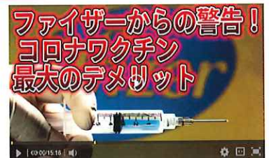
ファイザーからの警告！ コロナワクチン最大のデメリット【自然療法士ルイ】

まず、ここで「おかしい」と気づきましょう。新型コロナに効くのであれば1種類でいいですよね？ 「なぜ4種類」？。しかも、その1つは「プラセボ（偽薬）=効果ゼロの整理食塩水」。現在、「治験中」=「人体実験中」なのです。動物実験では全頭2年以内に死んだそうです。（メディアは当然知って..）プラセボの「比率が高い」のは何故なのでしょう？自分で調べて、自分で答えを導きましょう！