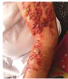
以上: コロナワクチンと皮膚症状 | 中村 篤司 ナカムラクリニック

プロの医師が大人数でワクチン中止を求める記者会見なのに、なぜ、大手メディアは一切取り上げないのか。なぜ国会議員は言及しないのか。そろそろ「テレビ・新聞はウソを言わない」という思い込みは捨てませんか。