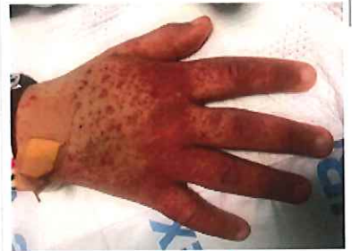
Rash is intriguing; drug reaction?