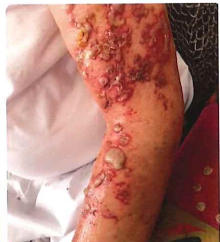
以上：コロナワクチンと皮膚症状 | 中村 篤史/ ナカムラクリニック

そもそも、コロナ?に掛かってもほぼ「無症状」であれば、勝手に免疫できると思うのですが。ワクチン打った人もコロナに掛かったとか聞くと、何のために危険を冒してワクチンを打つのでしょうか。コロナに掛かって重傷だ・・・と身の回りで聞いたこと何人いますか？ 私は0人です。