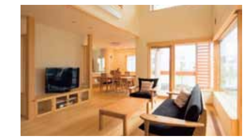
パッシブソーラー(大開口)