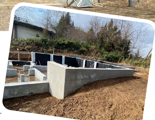
実際の土地高低差を利用した基礎